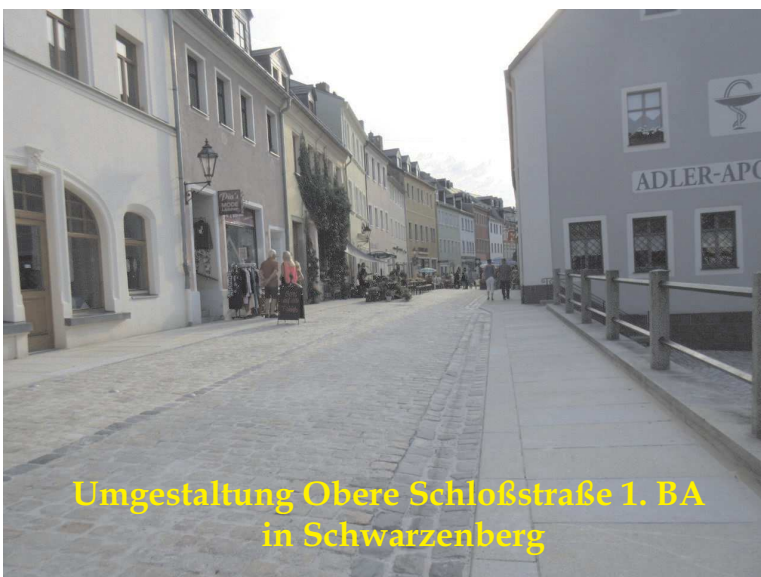
Umgestaltung Obere Schloßstraße 1. BA in Schwarzenberg